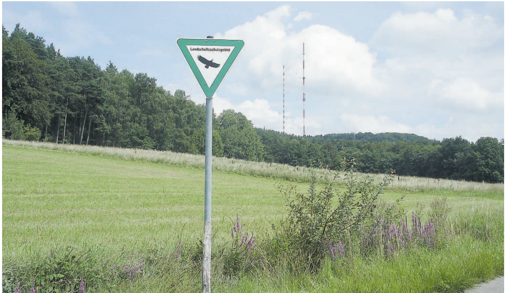
Auf der ungemähten Wiese im Hintergrund wird heuer noch die Goldkegel-Skulptur aufgestellt. Vom nahen Dillberg grüßt der Sendemast.

Heute, nach dem Fund weiterer Goldhüte, ist klar: Man kann es doch. In diesem Zusammenhang lassen sich auch die beiden bei der Nachuntersuchung mitgefundenen Bronzereifen einordnen, die zu einer Verstärkung der Hutkrempe gehört haben könnten. Man vermutet, dass „Priesterkönige“ der Urnenfelderkultur die Hüte bei Zeremonien getragen haben. nd