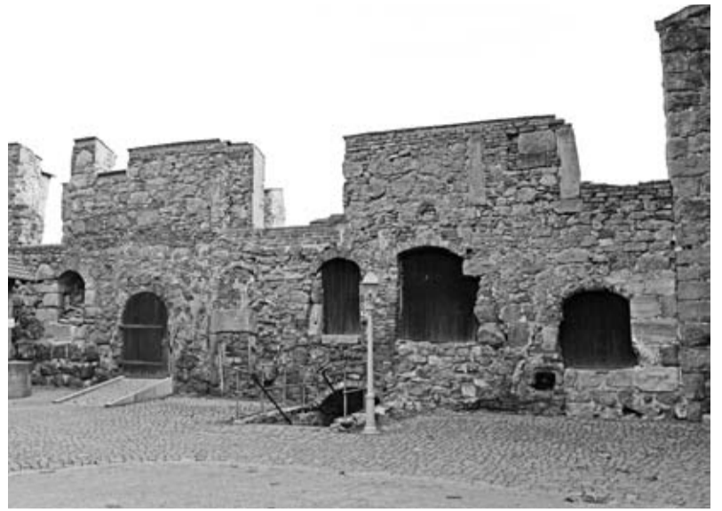
Konzepte für Burgruine und Burgplatz werden von allen Fraktionen angehmt.

Vorrang für Sanierung von Gebäuden und Straßen